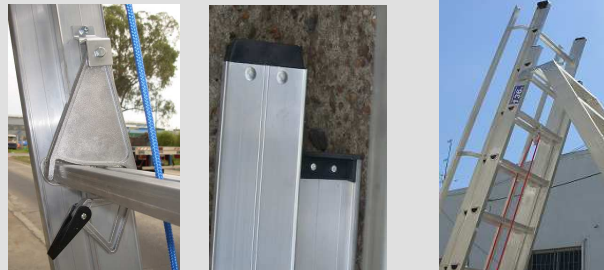
Punteras alto impacto Pasamanos opcionales