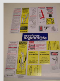
ETIQUETAS DE SEGURIDAD