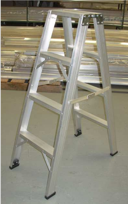
Escuadras de Refuerzo anti-torsión

Serie TSA – 1 – 400 - Cap.de carga 113 Kg