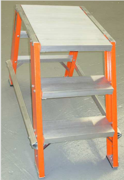
BURRO DE 1 Y 2 ESCALONES – 280 mm