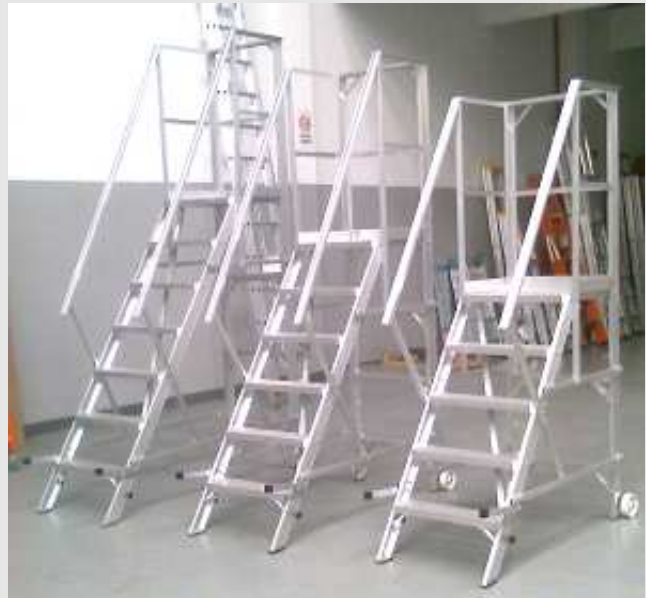
ESCALONES DE 75 – 140 – 280 mm