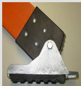
Zapatas antideslizantes Porta zapata Alto impacto