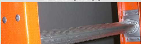
Traba peldaños Sistema Gravedad

Peldaños Planos en D – DURALUMINIO EMPLACADOS