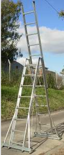
TDEA – DOBLE ACCESO