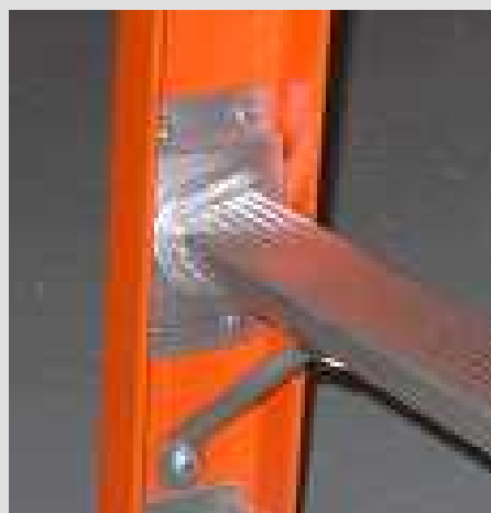
Escuadras de Refuerzo Anti-Torsión