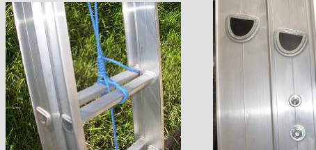
Traba peldaños Sistema Gravedad