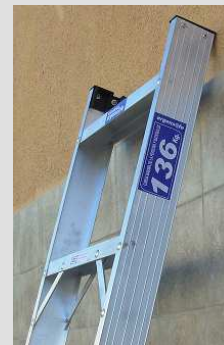
PUNTERAS DE ALTO IMPACTO

APTA USO EN LOCALES COMERCIALES ESTANTERIAS Y RIELES