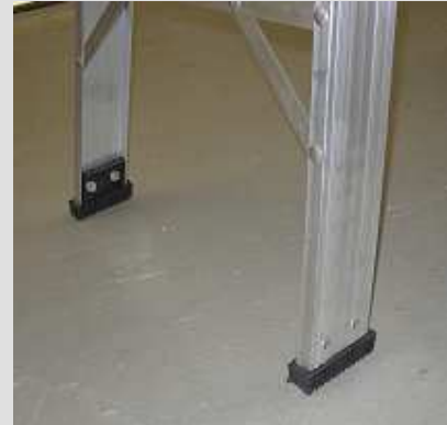
Zapatas de Goma antideslizantes