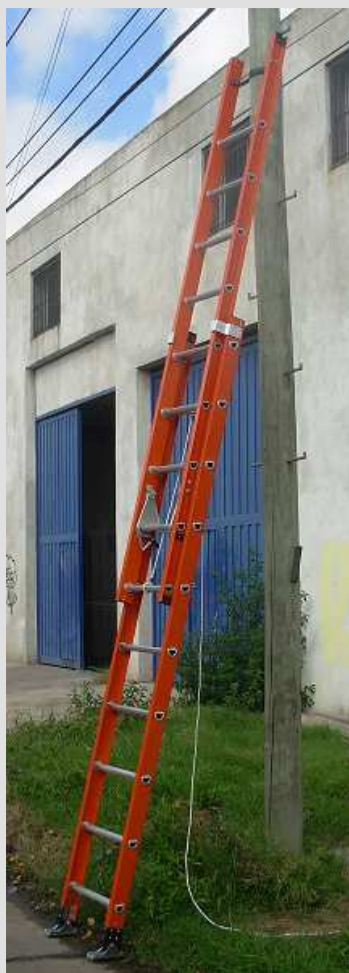
ETIQUETAS DE SEGURIDAD

Serie ED – 2– 52 - Cap.de carga 136 Kg.-