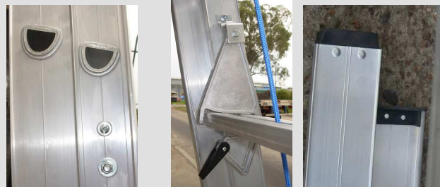
Punteras alto impacto