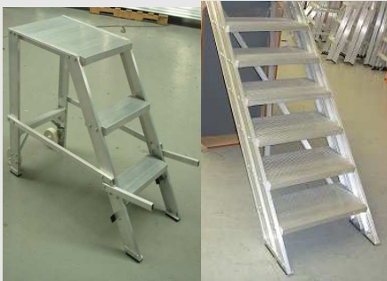
TABURETES – MUDANZERAS