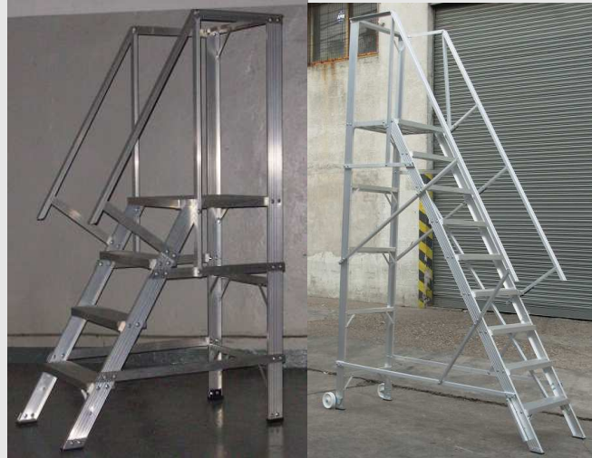
PLATAFORMAS DE ALTA RESISTENCIA ANTIDESLIZANTES