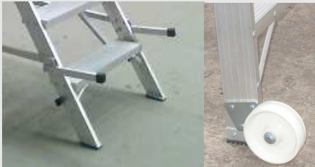
BARANDAS Y PASAMANOS