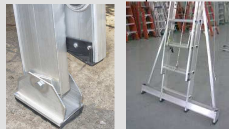
zapatas antideslizantes Base estabilizadora opcional