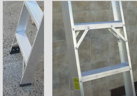
zapatas antideslizantes FIJAS DE GOMA