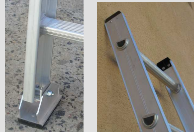
zapatas antideslizantes MOVILES