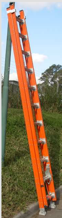
ETIQUETAS DE SEGURIDAD

Serie ED – 2 – 42 - Cap.de carga 136 Kg.-